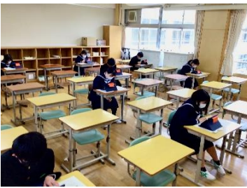
←英語テストの様子

来年度からタブレットを使った学力テストが行われます。本校でもオンラインテストの体験を兼ねた実証実験を行いました。1年生は選択式問題の回答や分数の回答の入力の方法など様々な回答の方法に慣れるための事前練習を行いました。2年生は英語の話すことのテストを練習しました。タブレットから流れる問題を聞いて、その答えを自分で録音して提出しました。オンラインテストを活用することで結果も従来より早くわかり、すぐにその結果を学習に生かせるようになります。