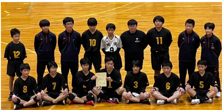
近畿大会出場おめでとう

男子バレーボール部は3月28・29日丸善インテックアリーナ大阪 他で行われる、第55回近畿中学生バレーボール選抜優勝大会に京都府の代表チームとして出場します。健闘を祈ります。