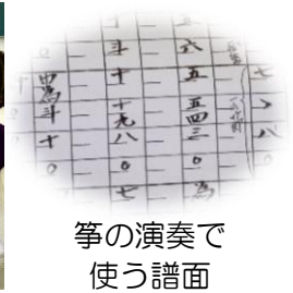
箏の演奏で使う譜面

今後新型コロナウイルスの感染状況により行事が変更、中止になる場合があります。ご了承ください。