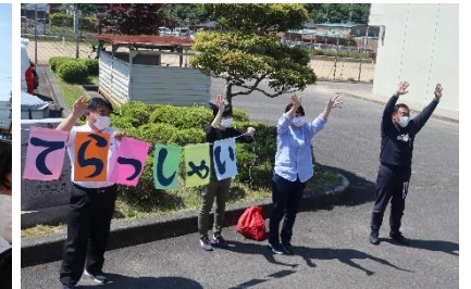
「行ってらっしゃい」